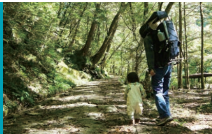
渓谷沿いの遊歩道は未舗装だが歩きやすく、子連れでも快適

西日本最高峰・石鎚山の南麓に源を発する面河川。その上流部に広がる面河溪は、国の名勝にも指定される県内有数の観光スポットです。標高1500mを超える山々の間を流れ落ちてきた急流が、長い年月をかけて谷筋を削って作り上げた渓谷美は圧巻。ダイナミックな風景を堪能しながら汗を流せば、心も体も癒やされます。