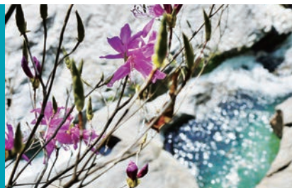
春になると溪谷の岩肌につつじが美しく咲き誇る

甌穴とは、川の流れの渦により石が同じ所を循環し、川底の岩盤を浸食してできる丸い穴のこと。八釜の甌穴群は、全国に多数ある甌穴の中でも大変大規模なもので、唯一、国の特別天然記念物に指定されています。四国カルストから流れ出た清水が、果てしない時間をかけて築き上げた自然の大彫刻を、ぜひ一度ご覧下さい!