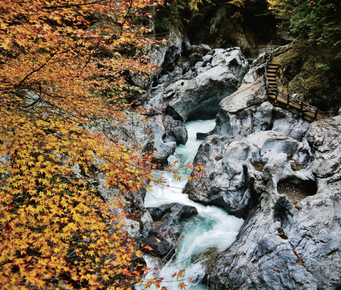
秋の紅葉と甌穴群が織りなす風景は格別!