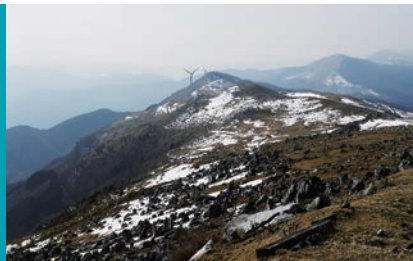
春先の四国カルストは残雪がうっすら残り、幻想的な景色が広がる

日本三大カルストの1つ、四国カルスト。中心部の姫鶴平から天狗高原にかけての帯は、尾根周辺が広大な草原となっており眺望抜群！石鎚連邦はもちろん、天気良ければ太平洋も望むことができます。また、放牧地でもある帯では牛がのんびりと草を食み、まるで外国にでも来たかのような高原の風景が楽しめます。