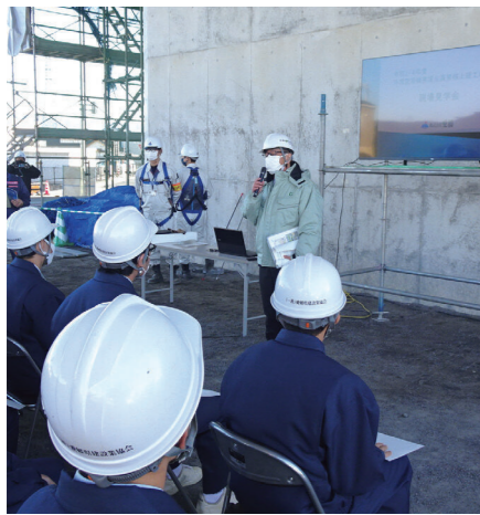
現場見学会の様子