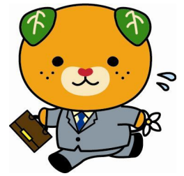
愛媛県イメージアップキャラクター みきゃん