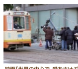
映画「世界の中心で、愛をさけぶ」撮影風景

参加方法:無料(要事前申込、定員120名先着) 申し込み方法:参加人数を明記し、愛媛国際映画祭公式HPまたは南海放送HPからご応募ください。 協力:NPO法人ジャパン・フィルムコミッション