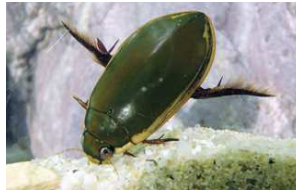
コガタノゲンゴロウ成虫

幼虫は細長い紡錘形で、体長は終齢で53.5mmに達します。近年、県内全域でコガタノゲンゴロウの成虫が確認されていますが、その分布は点在的で、2018年1月現在で、幼虫が確認され繁殖が確認され考えられるのは愛媛町の一部の水田地帯のみです。