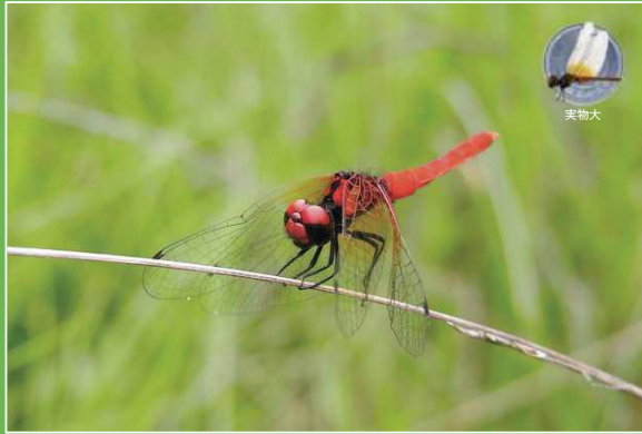
ハッチョウトンボ成熟オス

に成熟したオスは体全体が鮮やかな赤色になり、非常に存在感があります。全国的にも希少な種で、47都道府県のうち33都府県で絶滅危惧種にランクされており、愛媛県では唯一西条市でしか見ることができません。生物多様性センターでは、毎年、ハッチョウトンボの観察会を開催しています。一緒に、初夏の「赤い妖精」に会いに行きませんか?