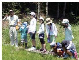
図1 ハッチョウトンボ観察