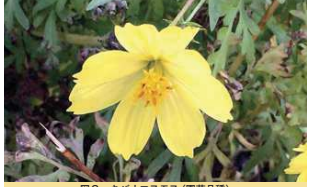
図2 キバナコスモス(園芸品種)

オオキンケイギク( Coreopsis lanceolata L.)とは、北米原産で、高さ70cm以上になる大型のキク科の多年草です。花の時期は5～7月で、鮮やかな黄色い花を咲かせます。日本には明治時代中期に鑑賞用として導入され、その後、法面緑化として広範囲に使用されたものが逸出し野生化しました。本種は繁殖力が旺盛なので、土手や河原などに