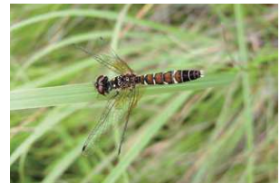
ハッチョウトンボ成熟メス

ハッチョウトンボの体色は、羽化してから日数が経たない未熟な時はオス・メスともに薄いオレンジ色していますが、成熟するとオスは裏紙のような真っ赤に、メスは右の写真のように、黄色地に黒や褐色の斑紋が現れます。国内の分布域は本州、四国、九州で、平地～丘陵地の陽当たりが良く、ミスゴクなどがえて泥が堆積した湿地に生息しています。愛媛県内での観察事例では、成虫は4月下旬から羽化し、9月上旬まで見られますが、個体数が多いのは5月下旬～6月上旬です。成熟した雄は、湿地内の開けた水面のある水辺に生えた植物の細い茎などに止まって調整りをもち、他の雄が侵入すると激しく争います。雌ではレッドデータブック絶滅危惧1類(CR+EN)にランクされているほか、「愛媛県野生動物種の多様性の保全に関する条例」により特定希少野生動物種に指定されており、採集等が禁止されています。