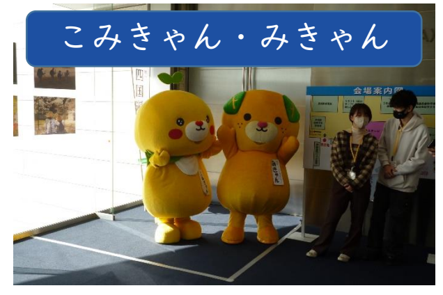
こみきゃん・みきゃん