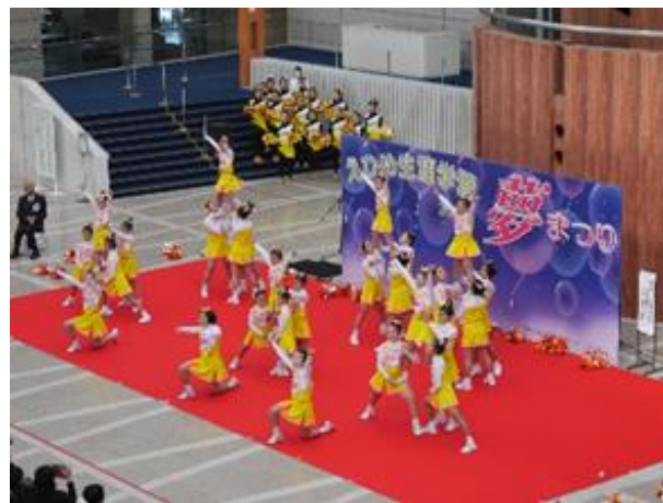
松山キッズチアスクール