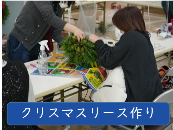
クリスマスリース作り

また、生涯学習センター、総合科学博物館、歴史文化博物館、美術館等による特設コーナー（特別展示や体験教室など）では、年齢を問わず多くの方々が楽しんでいました。