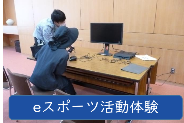
eスポーツ活動体験