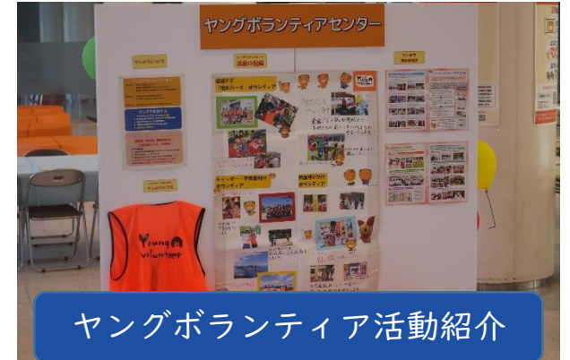
ヤングボランティア活動紹介