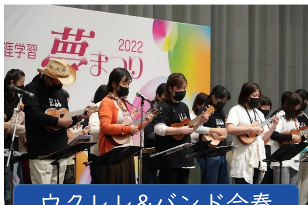
ウクレレ&バンド合奏