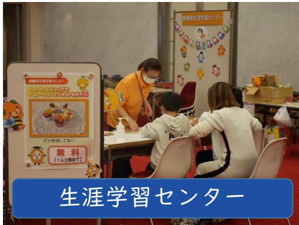
生涯学習センター