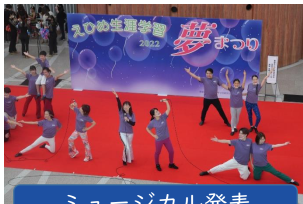
ミュージカル発表