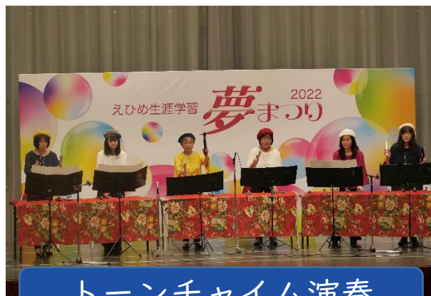
トーンチャイム演奏