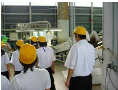
ペットボトル再生の見学