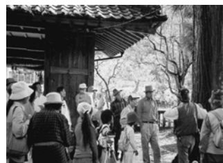
環境マイスター活動状況