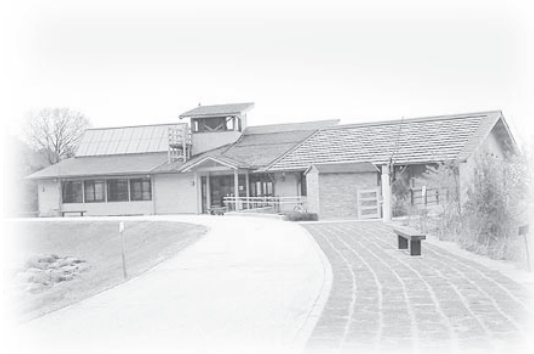
えひめエコ・ハウス全景

指定管理者制度の導入に伴い、平成18年4月からは、イヨテツケーターサービス株式会社に管理、運営を委託している。