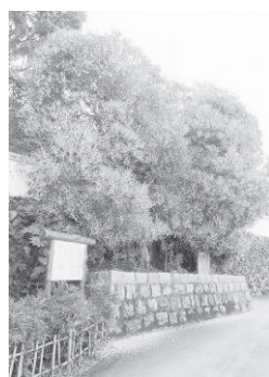
西条王至森寺の金木屋