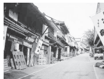
内子町の町並みと和ろうそく