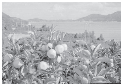
西宇和の温州みかん

この事業に本県からは、「愛媛西宇和の温州みかん」（愛媛県）、「 さいじょうおうしもりじ 西条王至森寺の きんもくせい 金木屋」（西条市）、「内子町の町並と和ろうそく」（内子町）の3件が認定された。