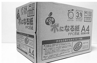
「えひめの木になる紙」

また、平成25年度には、県内でオフセット・クレジットの創出に取り組む市町や森林組合などのプロジェクト事業者等により結成された「えひめカーボン・オフセット推進協議会」が行う同クレジットの販売促進活動等を支援するため、新たに「オフセット・クレジット（J-V E R）販売促進事業」を開始し、カーボン・オフセットの普及啓蒙活動や県産クレジットの販売促進活動等を支援した。