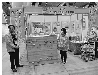
平成26年3月4日「カーボン・マーケットEXPO 2014」へのブース出展（東京国際フォーラム）