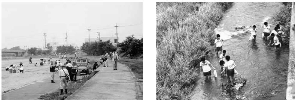
【愛リバー・サポーター清掃美化活動】

平成12年度の制度創設以来、27年度末現在で県下20市町の107河川で251団体を認定し、各団体において清掃美化活動等が実施されており、各団体の構成員総数は17,544人、サポーター区間延長は約181kmにも及んでいる。