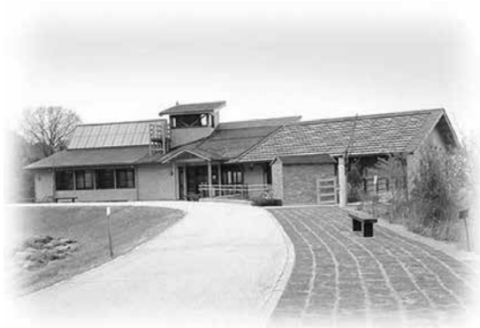
【えひめエコ・ハウス全景】