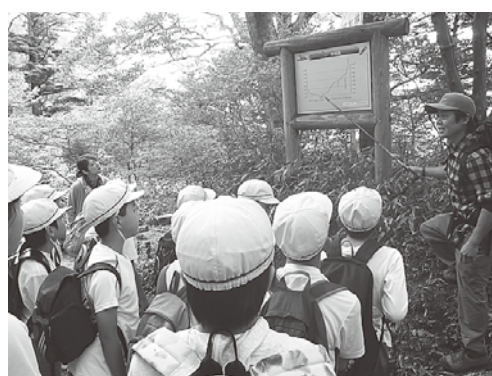
【環境マイスター活動状況】