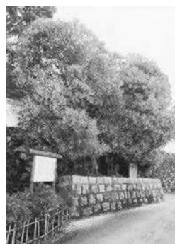
【西条王至森寺の金木屋】