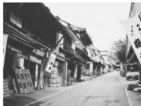
【内子町の町並みと和ろうそく】