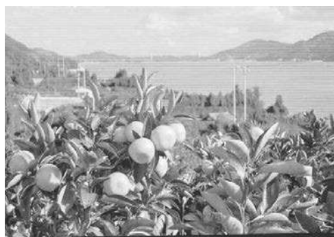
【西宇和の温州みかん】

この事業に本県からは、「愛媛西宇和の温州みかん」 さいじょうおうしもりじ （愛媛県）、「西条王至森寺の金木屋」 きんもくせい （西条市）、「内子町の町並みと和ろうそく」（内子町）の3件が認定された。