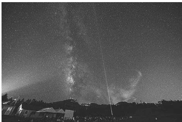
【エコツアー（星空観察）】