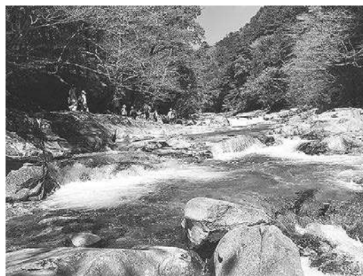
【エコツアー（面河溪谷トレッキング）】