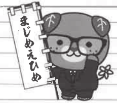
愛媛県イメージアップキャラクター みぎやん