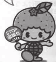
愛媛県地球温暖化防止キャラクター ストッピー