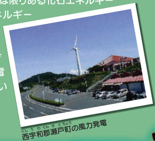
西宇和郡瀬戸町の風力発電

もう一つ、愛媛県で定めたのが「愛媛県地域新エネルギービジョン」。これは限りある化石エネルギーにかわる新しいエネルギーを導入することを自指して作成されたもの。電力の分野では太陽光や風力発電などが進められています。