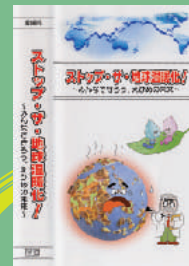
地球温暖化防止啓発ビデオ