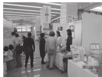
【展示即売イベントの開催状況】