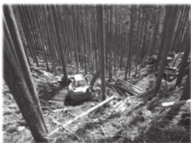
【高性能林業機械による 森林整備】

さらに、近年、ゲリラと呼ばれる集中豪雨により、県下でも山地災害が増加傾向にある中、被災した森林を早期に回復させるため、治山事業による施設整備を実施するほか、重要な水源地域や山地災害危険地区においては、森林の水源かん養機能や土砂流出防止機能等を高めるための森林整備を実施している。