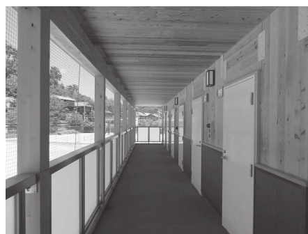
【県立内子高校 部室】