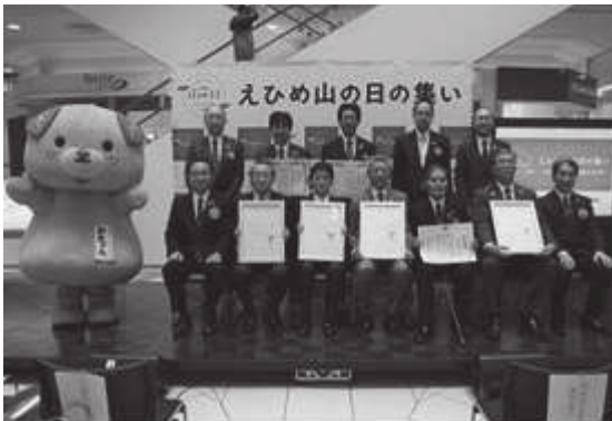
【えひめ山の日の集い】

当取り組みでは、森林に対する理解と保全活動への県民参加を促進する目的で、毎年、多くの県民の参加を得て「えひめ山の日の集い」を開催するとともに、ホームページ等による啓蒙・普及を行った。また、森林保全等への自発的な参加を進めるため、県民からの提案型公募事業に対する支援を行った。