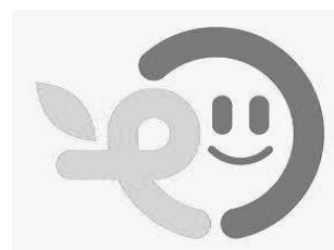
【愛媛県資源循環優良 モデルシンボルマーク】