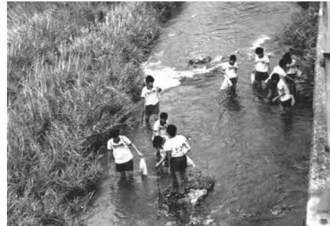
【愛リバー・サポーター清掃美化活動】