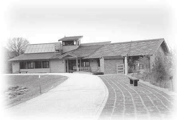
【えひめエコ・ハウス全景】