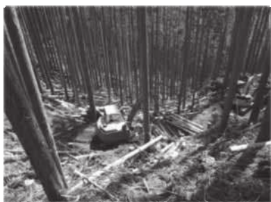
【高性能林業機械による 森林整備】

さらに、近年、ゲリラと呼ばれる集中豪雨により、県下でも山地災害が増加傾向にある中、被災した森林を早期に回復させるため、治山事業による施設整備を実施するほか、重要な水源地域や山地災害危険地区においては、森林の水源かん養機能や土砂流出防止機能等を高めるための森林整備を実施している。