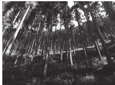
【森林の多面的機能を 高める整備】