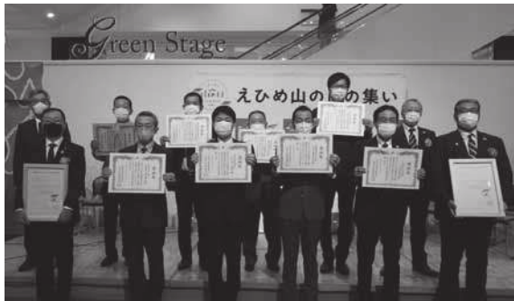
【えひめ山の日の集い】

当取り組みでは、森林に対する理解と保全活動への県民参加を促進する目的で、毎年、多くの県民の参加を得て「えひめ山の日の集い」を開催するとともに、ホームページ等による啓蒙・普及を行った。また、森林保全等への自発的な参加を進めるため、県民からの提案型公募事業に対する支援を行った。