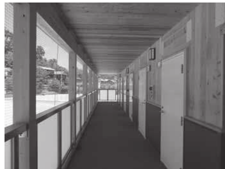
【県立内子高校 部室】