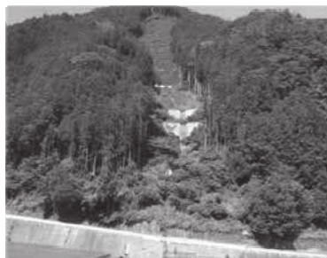
【山地災害跡地への 治山施設整備】