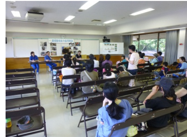
意見交換会開催状況（小学生の親子）

以上のことから、利用者のニーズに応じた、真に必要な設備や仕掛けを備えた施設整備の方向性を打ち出すことができた。