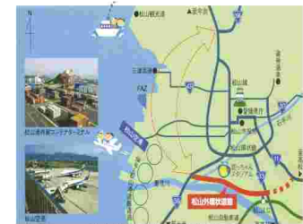
松山外環状道路整備計画

本四3橋の開通や四国8の字ルートの進展で、本州等との交流が大幅に増大する一方、他地域との競争あるいは連携が求められており、既存施設の効果を最大限に発揮させるための高速道路ネットワーク等の早期完成が強く望まれています。 また、経済の急速なグローバル化の進展により、企業活動の国際化など物流の広域化が進み、貿易活動の拠点や高速道路等とのアクセス強化が必要となっています。