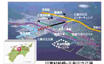
川東村松線・三島川之江港

港湾整備におけるマルチモーダル施策実現のための街路事業との連携、コスト縮減にも資する道路事業との連携及び港湾整備と一体となった都市開発用地等創出によるまちづくり等との連携を進めます。