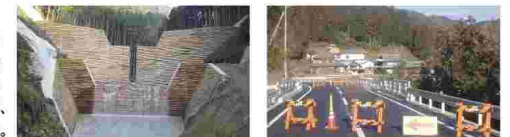
(一)重信川水系つら川(砥部町川登) 間伐材バリエード(一)池田中山線(内子町)