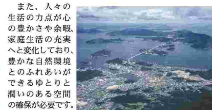
来島海峡大橋と瀬戸内のしまなみ

標高西日本一の霊峰石鎚山(標高1,982m)を始めとする美しい山々とそこから流れ出す無数の清流、風光明媚な大小200余りの島々が散在する瀬戸内海や宇和海など、全国に誇れる自然豊かな景観に恵まれています。 これらの海、山、川等の貴重な財産を守り育て、未来に引き継いでいくため、生活排水等の污水浄化等により河川や海域等の公共用水域の水質の改善や保全を図るなど、自然環境に配慮した施策が必要となっています。