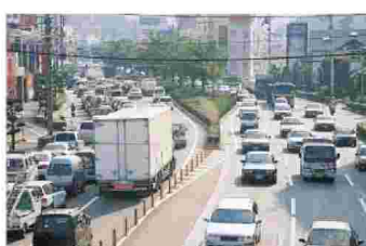
幹線道路に集中する交通(松山南環状線)(松山市朝生田町付近)

高速交通体系の整備推進に伴い、県民生活や経済活動の広域化と利便性向上が図られる中、県境を越えた都市間競争に対応するため、渋滞緩和や主要施設とのアクセス向上等の都市内交通の円滑化や、快適で賑わいのある魅力あるまちづくりなど、都市の機能強化に取り組むことが必要となっています。