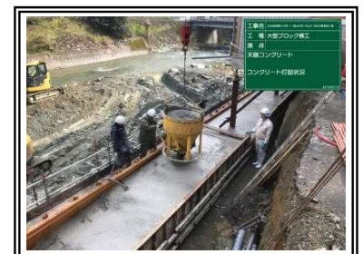
天端コンクリート