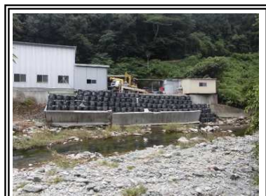
仮復旧完了（大型土嚢）