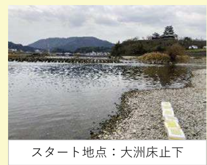
スタート地点：大洲床止下