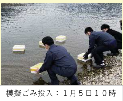
模擬ごみ投入：1月5日10時