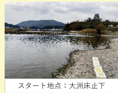
スタート地点：大洲床止下