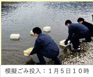
模擬ごみ投入：1月5日10時