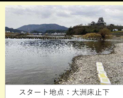
スタート地点：大洲床止下