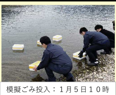
模擬ごみ投入：1月5日10時