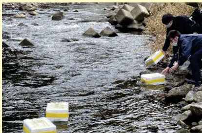
模擬ごみ投入：1月26日12時