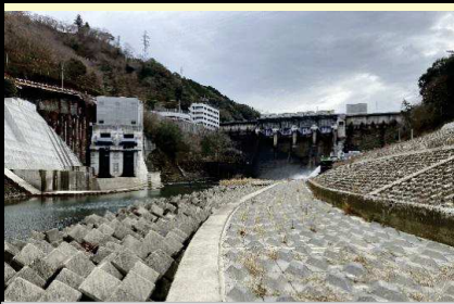
スタート地点：鹿野川ダム直下

愛媛県南予地方局大洲土木事務所管内図（承認番号 平29情使,第689号、第805号承認番号 平29情復,第805号）加筆