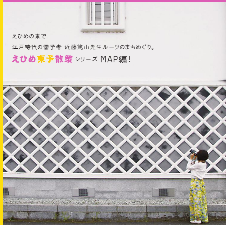
えひめの東で 江戸時代の儒学者 近藤篤山先生ルーツのまちめぐり。 えひめ東予散策 シリーズ MAP編!