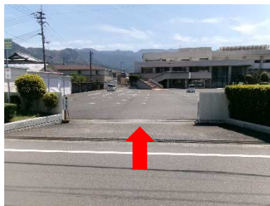
(道路北側から撮影)