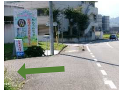
(公民館西側の通路からも出入り可能です。)