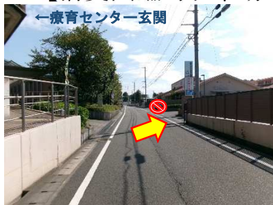
(道路西側から撮影)