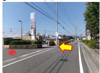
(道路東側から撮影)