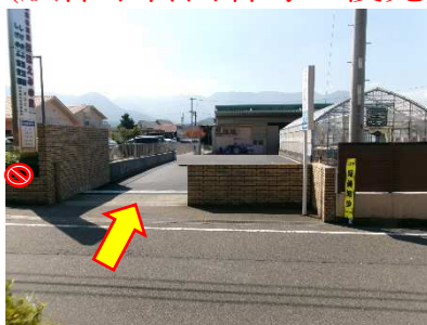
(道路北側から撮影)