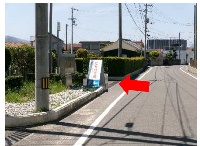
(道路東側から撮影)