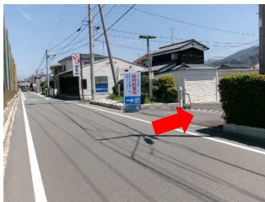
(道路西側から撮影)