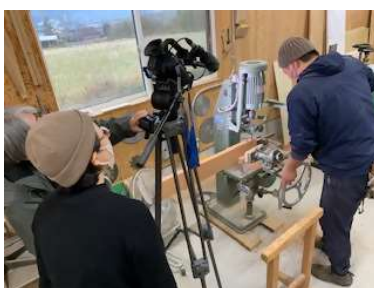
動画作成ワークショップ(動画撮影)