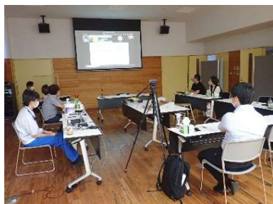
3社合同商品開発会議