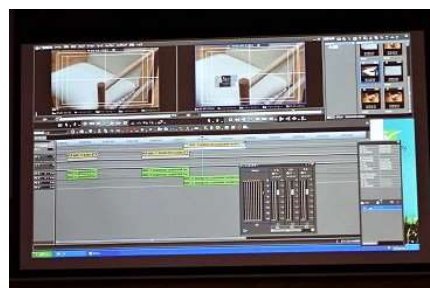
動画作成ワークショップ(動画編集)

本事業で開発した製品は、地場産品製造事業者のアウトドア分野における需要を掘り起こす製品として期待できます。また、販売促進のための動画作成は、参加者の動画作成の知識と技術への理解を深め、今後の地場産品製造業の認知度向上や地場産品の販売促進など、地域経済の活性化が期待できます。