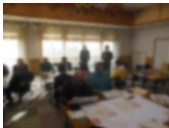
森脇先生による総括