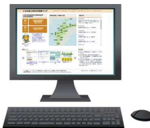
4 ホームページで公開