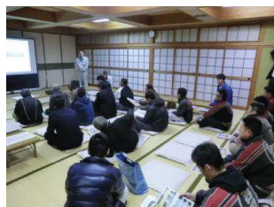
地元説明会の開催