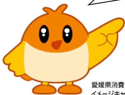
愛媛県消費生活相談窓口 イメージキャラクター 「こまどりのPIPI(ピビ)」