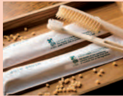
古米・砕米を原料の一部にしたホテルアメニティ