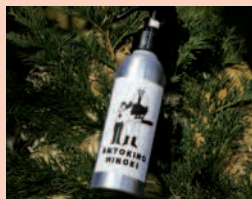
ヒノキ精油由来の消臭ミスト