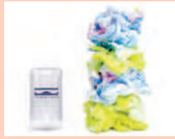
タオルの埃からできた今治のホコリ(着火剤)