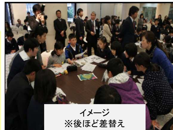
イメージ ※後ほど差替え ミーティングの様子

各校のいじめ防止対策の取組が話し合われ、参加した子どもたちは、その後の学校生活でいじめ解決に対して意欲的に活動している。そのなかで子どもたちから提案された、いじめをなくすための合言葉「さかせよう 笑顔の花つみとろういじめの芽」の横断幕を作成し、市内全小中学校に配布し、掲示している。また、この活動を通して教員のいじめの問題に対する対応力は確実に上がっており、未然防止、早期発見、早期解決を図ろうとするケースが増えている。