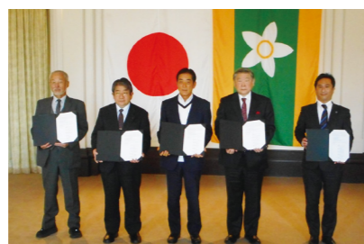
愛媛県デジタル人材の育成・確保に向けた連携・協力に関する覚書締結式