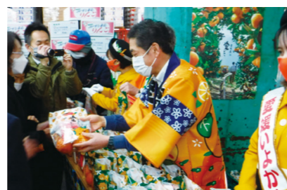
知事トップセールス