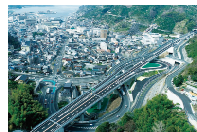
大洲・八幡浜自動車道

行政分野では、人口規模や行政需要などに応じた適正な財政規模・組織体制を構築し、デジタル技術を活用したスマート行政の推進、住民サービスの利便性向上のための行財政改革に取り組み、今後、県事業の重点化やコスト縮減を図りつつ、将来にわたって持続可能な社会基盤を維持し、暮らしやすく住み続けられるまちづくりを進めます。