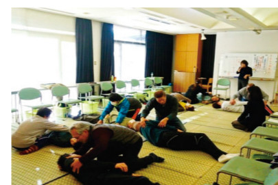
介護実技研修(在宅介護研修センター)

誰もが住み慣れた地域で安全・安心に暮らすことができるよう、ニーズに応じた適切な福祉サービスの提供・充実を図るとともに、地域ぐるみで支える社会の仕組みを整え、県民同士が助け合い支え合いながら暮らし続けることができる、活力ある福祉社会の形成を目指すとともに、保護者からの養育が受けられず社会的養育が必要になった児童に対する支援の充実を図ります。