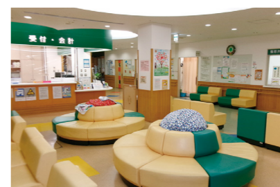
子ども療育センター