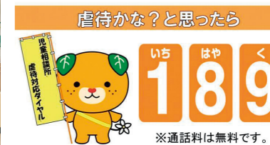
児童相談所虐待対応ダイヤル