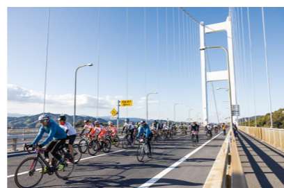
サイクリングしまなみ2022