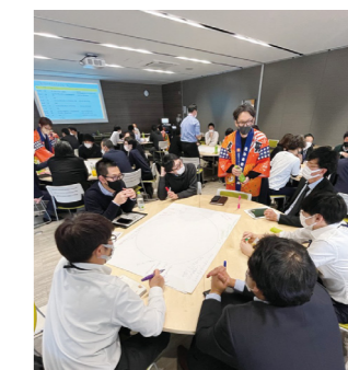
チーム愛媛DXウィンターキャンプ(愛媛県・市町DX担当職員合同研修)