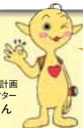
県民健康づくり計画 イメージキャラクター ヘルシーくん

実践できた項目にはチェックしよう。 10か条全て実践できるように、 普段の生活で気を付けてみよう！