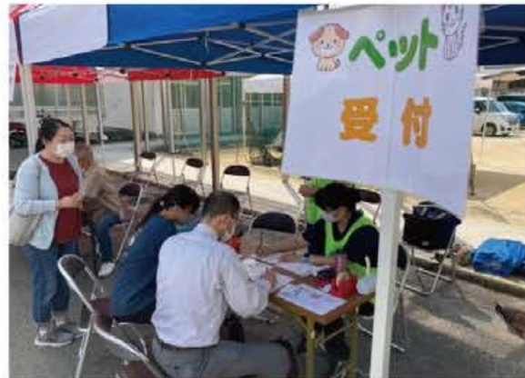
ペットの同行避難訓練