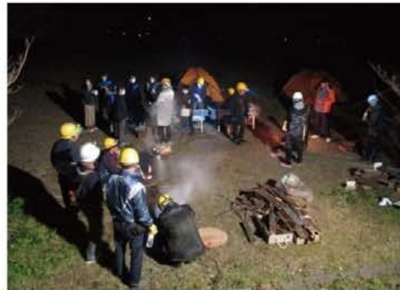
指定緊急避難場所への避難状況

なお、参加者への訓練実施における準備や注意点等は、事前に講師を招へいし、研修及び指導を実施した。