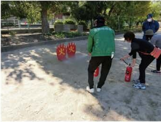
第3回「初期消火・救出救護訓練」