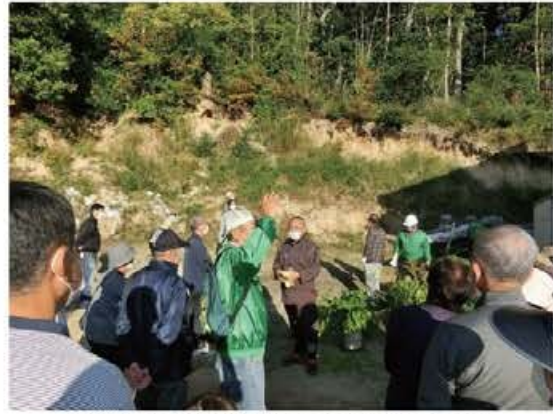
第4回「土砂災害から身を守る訓練」