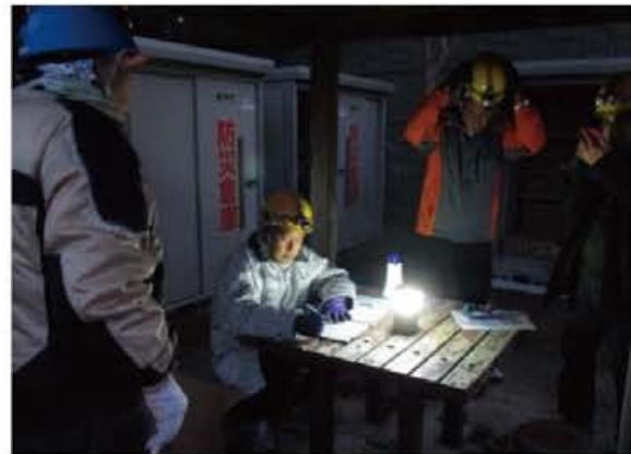
夜間における活動の検証