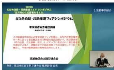
活動事例紹介(高浜地区自主防災連合会)