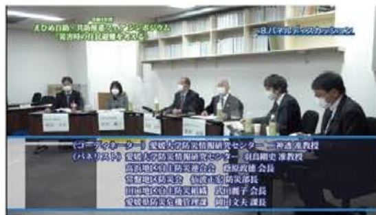
パネルディスカッション