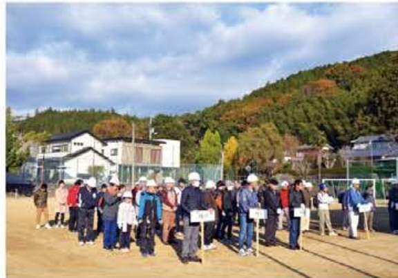
防災運動会の様子

当自主防災組織は5つの行政区で構成しているが、運動会実施の際は同じ行政区だけのグループにならないようグループ分けを行い、普段面識のない人と協力して訓練を行う事で、楽しく防災意識の高揚を図る事ができた。