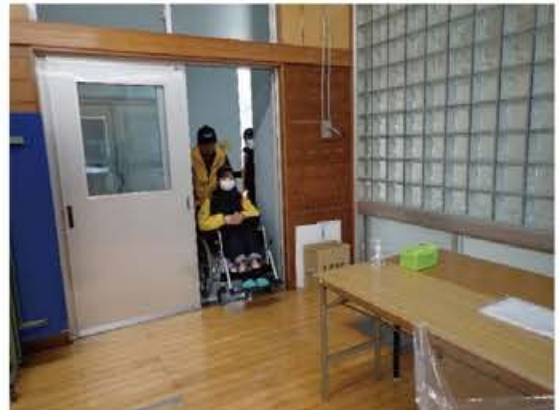
要支援者搬送状況②