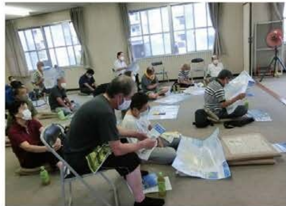
第2回「大雨・洪水に備えた訓練」