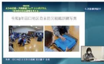
活動事例紹介(田口地区自主防災組織)