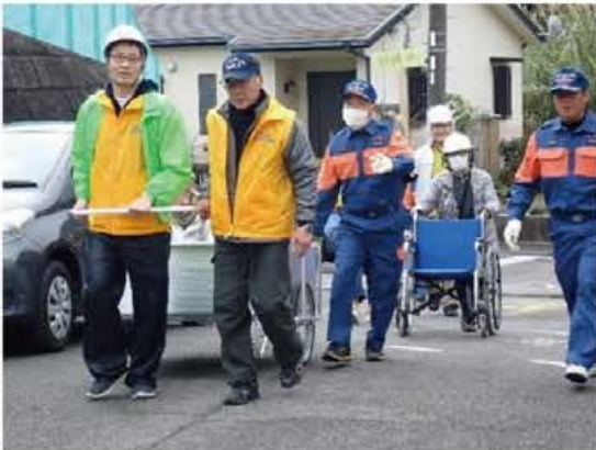
要支援者搬送状況①