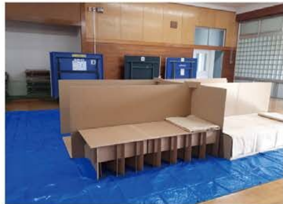
段ボールベッドの組み立て