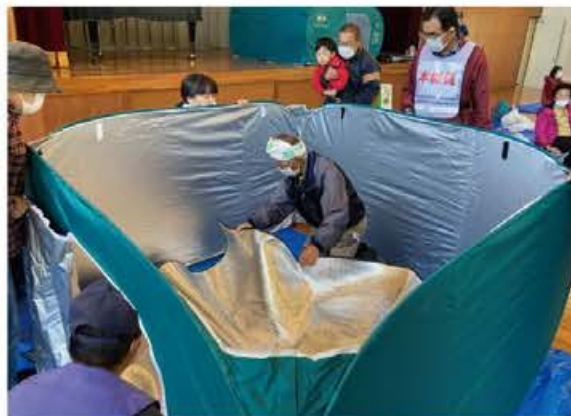
避難所開設・運営訓練