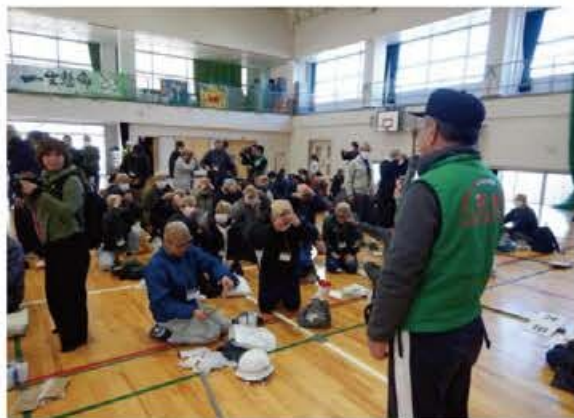
農友地区防災講座