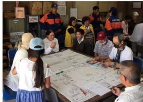
避難所運営ゲームの状況