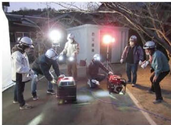
発電機や照明機器の運用方法の確認