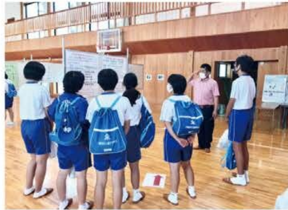
展示ブースの様子

主な取組として、「ポータブルワイヤレスアンプを使用した情報伝達訓練」、「防災グッズ(命のカード)の作成」、「簡易ベッドを使用した避難所生活体験」、「ペット同行避難訓練」、「防災士による展示物の説明(家庭備蓄など)」を実施した。また、協力団体として地域の社会福祉施設等に声掛けを行い、展示ブースに出展してもらい、訓練参加者への情報発信を行った。