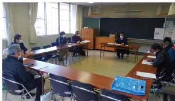
ワークショップ開催状況

平成30年7月の西日本豪雨災害の経験を踏まえ、地域住民が主体となって地区防災計画を作成した。