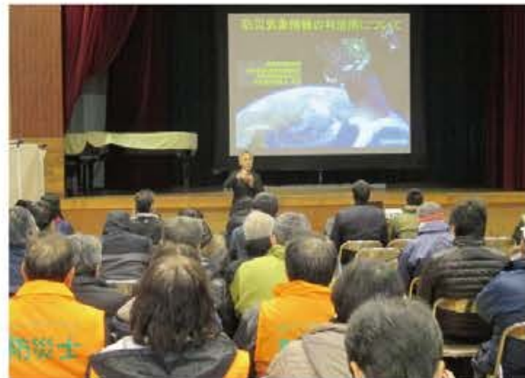
松山地方気象台による研修