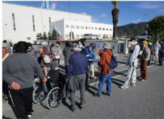
避難者名簿を作成する防災士