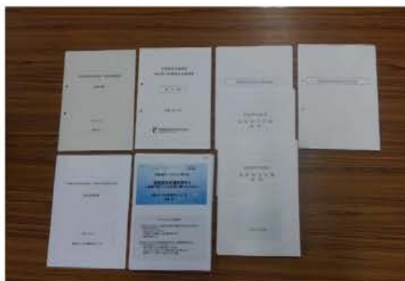
完成した計画・資料

また、まちあるきを実施して確認した避難ルートや地域の危険箇所を防災マップに反映したため、地域住民にとってわかりやすく、身近な計画となった。