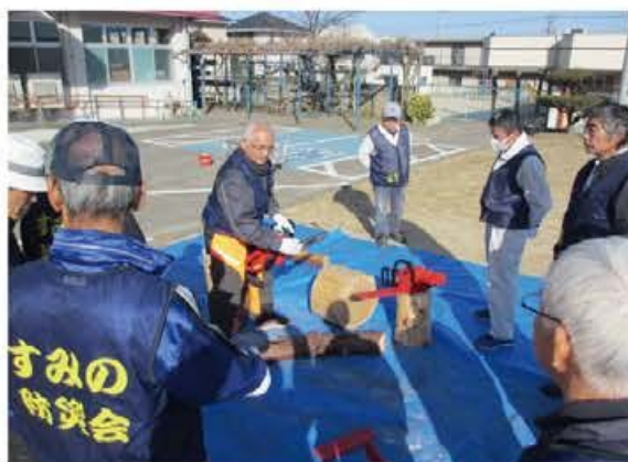
倒木を想定した避難経路確保訓練