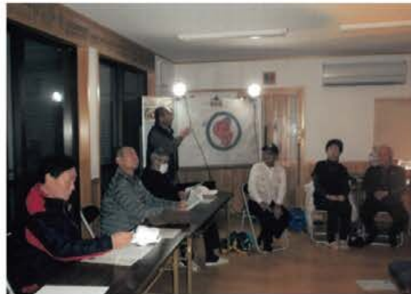
発電機や照明器具の使用講習