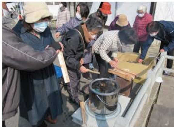
かまどを用いた炊出し訓練

共助訓練として、運営本部のテント設置、無線機を用いた被害状況の確認、消火訓練、チェーンソーや担架を用いた救出搬送訓練、かまどを使用した炊出し訓練や、夜間での災害に備え、発電機や投光器などの資機材の確認を行った。