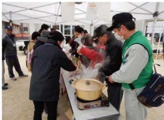
炊き出し訓練状況

さらに、訓練結果を地区内の小さな行政区単位へ情報共有を行い、今後の防災対策に活かせるよう努めた。