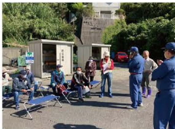
津波一時避難場所への避難訓練

避難所運営では、食料・物資班による炊き出し訓練として、調理の一部を屋外で実施した。