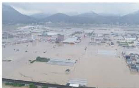
西日本豪雨災害時の大洲市

近年、地震や大雨などによる多くの被害が全国各地で発生しています。愛媛県においても平成30年7月の西日本豪雨で甚大な被害を受け、災害による死者が27名、避難生活中の体調不良による災害関連死が6名を数えたほか、住家被害は全壊627戸、半壊3,118戸、床上・床下浸水2,918戸の合計6,663戸(R3.3.1現在)にのぼりました。