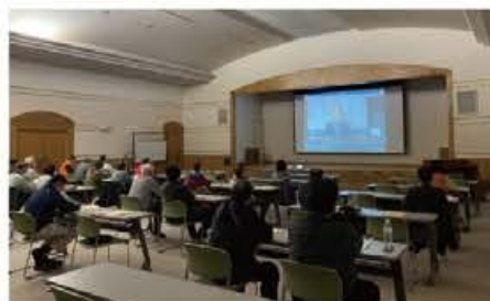
オンライン配信会場の様子