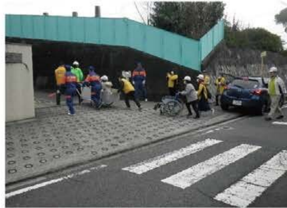
避難行動要支援者を避難所まで搬送

その他、避難所となる中学校の体育館で、段ボールベッドの組み立てなど避難所開設訓練も実施した。