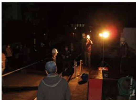
防災資機材の使用方法的説明状況

さらに、集会所では、「避難者カード使用による避難者受付訓練」、「非接触型体温計での検温」を実施するなど、避難者の受け入れの流れを確認した。