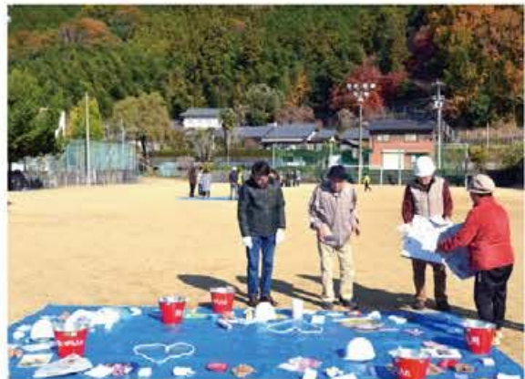
防災運動会の様子