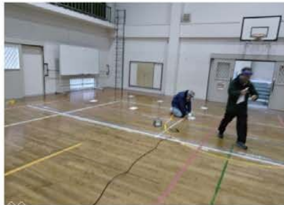
避難者受入設定配置場所の確認