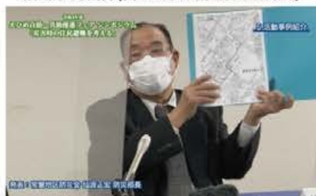
活動事例紹介(常盤地区防災会)