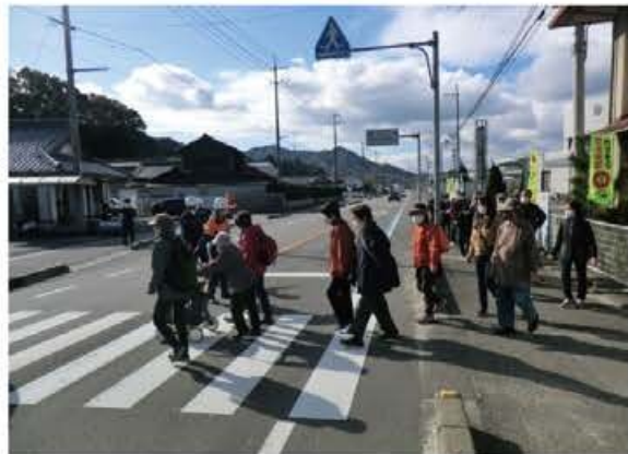
避難中の安全確認を行う消防団員等