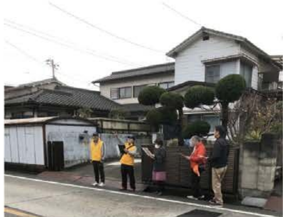
要支援者安否確認の状況