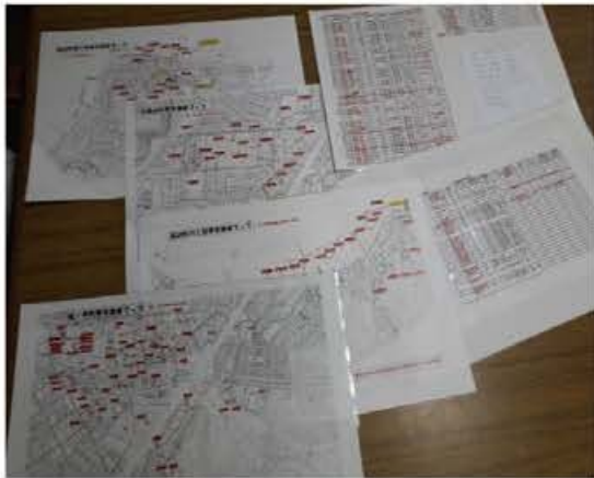
要支援者台帳とマップ