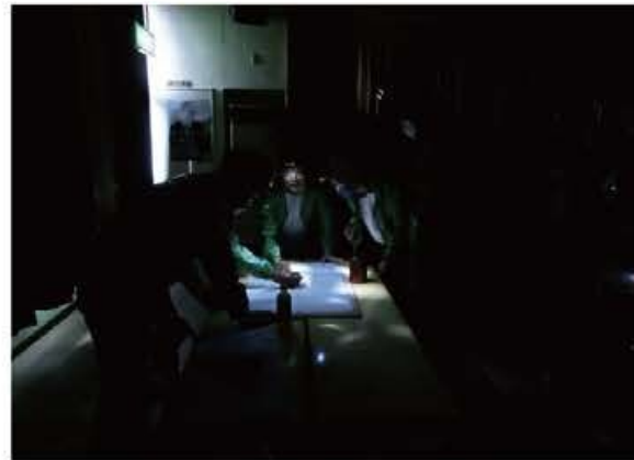
第1回「情報収集・記入訓練」

第4回「土砂災害から身を守る訓練」として土砂災害発生箇所状況確認や被災者体験談等による避難の必要性を学習した。