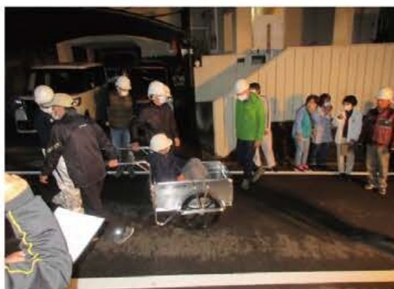
避難行動要支援者の搬送救助訓練